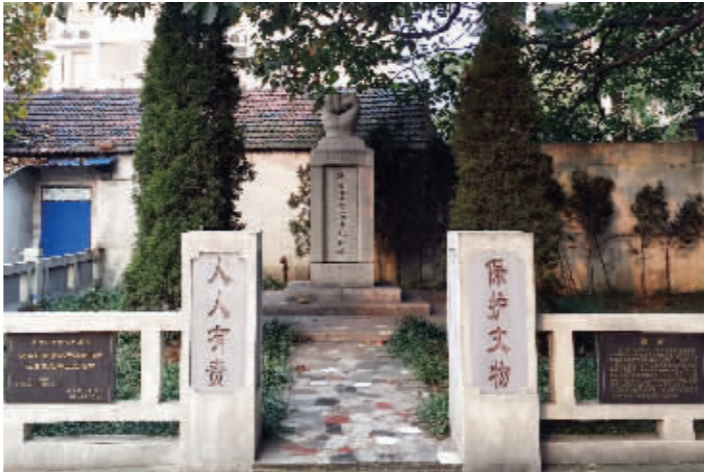
竖立在一片居民自建房中的浦口抗日蒙难将士纪念碑

晚上, 有中国士兵暴动外逃, 鬼子就架起机枪射击, “死了好多人, 泡在水塘里。附近有个大坑, 尸体被埋在坑里。”