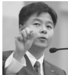
华裔国会议员刘云平

华裔刘云平在美国中期大选中，以55%的得票率成功击败对手，成为继赵美心、孟昭文之后第三位华裔众议员。选举结果显示，孟昭文不战而胜，成功连任；赵美心则以58%的得票率连任成功。另外，有一半华裔血统的谭美也在伊利诺伊州获胜。 值得一提的是，代表共和党参选的埃利丝·斯特凡尼克顺利当选纽约州联邦众议员，从而以30岁之龄成为美国国会史上最年轻的女议员。