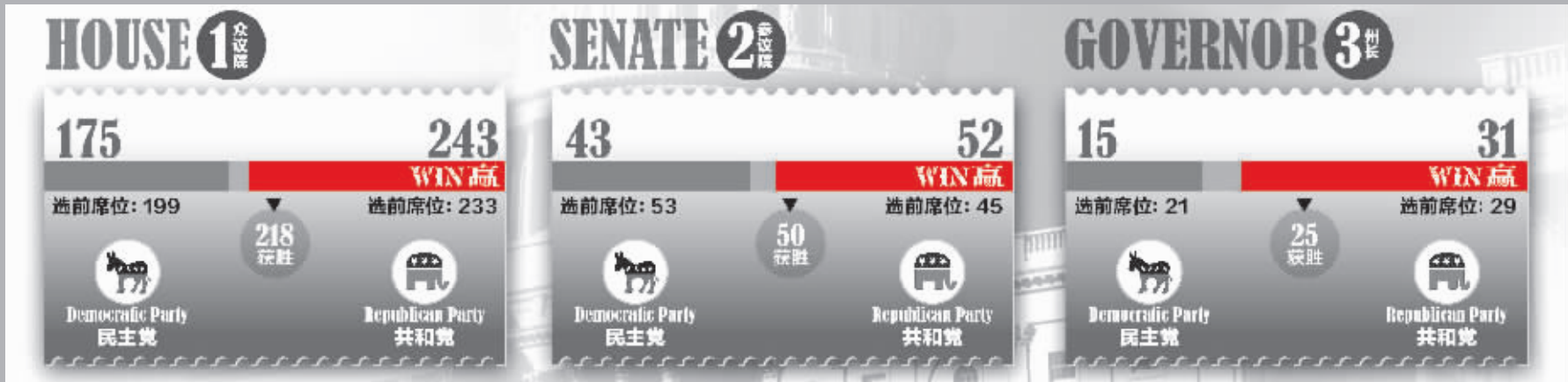
制图 沈明 (数据截至北京时间昨天18:20)