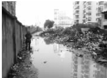
稻香路整治前(左,拍摄于2009年12月)后(右,拍摄于昨日)比较