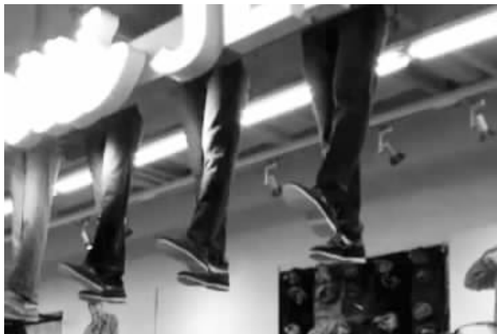
机器人腿按照一定频率,在天花板下一前一后地进行着踢腿运动

“天花板上居然吊了一排人腿,还会动。”近日,有网友爆料称,无锡某大型购物广场有一家服装店为了推销牛仔裤,在天花板上安装了两排穿牛仔裤的“机器人腿”,这些人腿模型不仅效果逼真,还会活动。这种夸张的营销方式吸引了不少市民拍照围观,但也吓到了不少初次进店的女顾客。