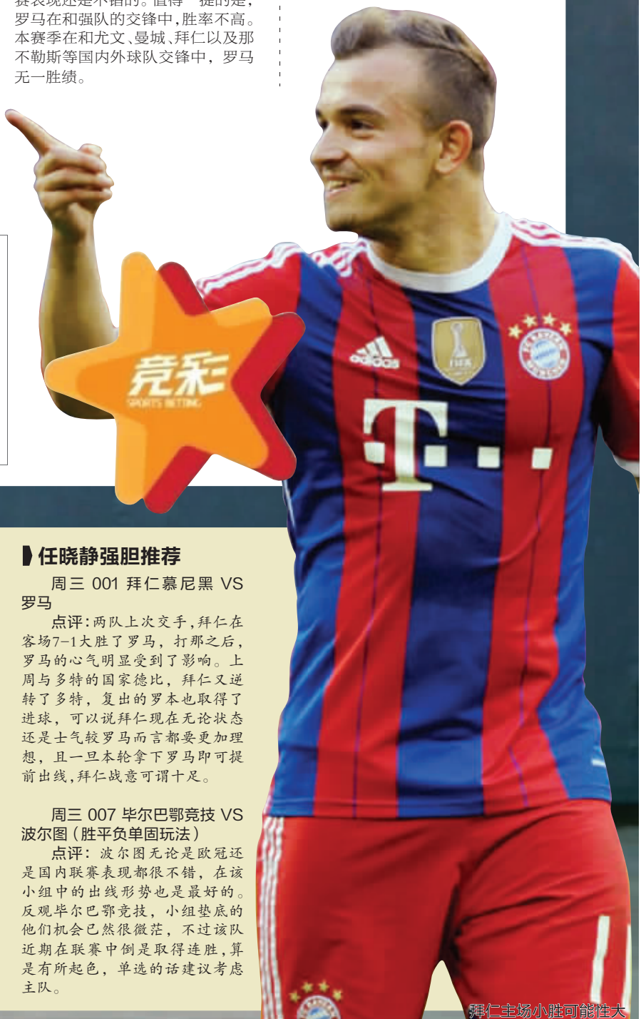
拜仁主场小胜可能性大

除了主客场表现出的问题外,拜仁上周末刚刚和多特蒙德有过一场国家德比战。这场比赛拜仁的重视程度丝毫不亚于欧冠,而且比赛的对抗性也不逊色欧冠。不到一周的时间之内,连续遭遇多特蒙德和罗马这样的劲敌,拜仁赢球可以做到,但是要想大胜难度还是很大的。本场比赛,看好拜仁小胜。