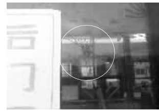
车门上被打了一个洞