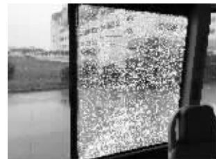
车子边窗整块玻璃被震碎