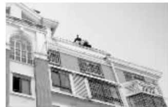
事发现场

昨天上午8点,连云港市区九龙城市乐园小区一栋楼的楼顶突然出现了一家三口,随时都要轻生的样子。经过现场人员3个小时的劝说,才成功将三人救下。