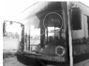
驾驶室前挡风玻璃处被击中

目前,当地派出所及连云港市公安局公交分局正在对此事展开调查。公交公司也呼吁市民如果有线索可与公交公司和警方及时联系。