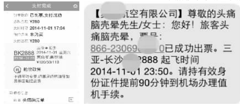
购票支付成功页面