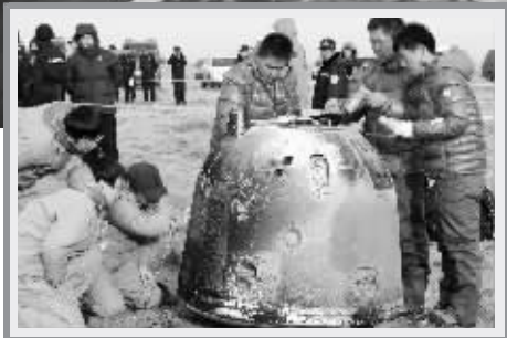
11月1日,工作人员对返回器进行现场检测