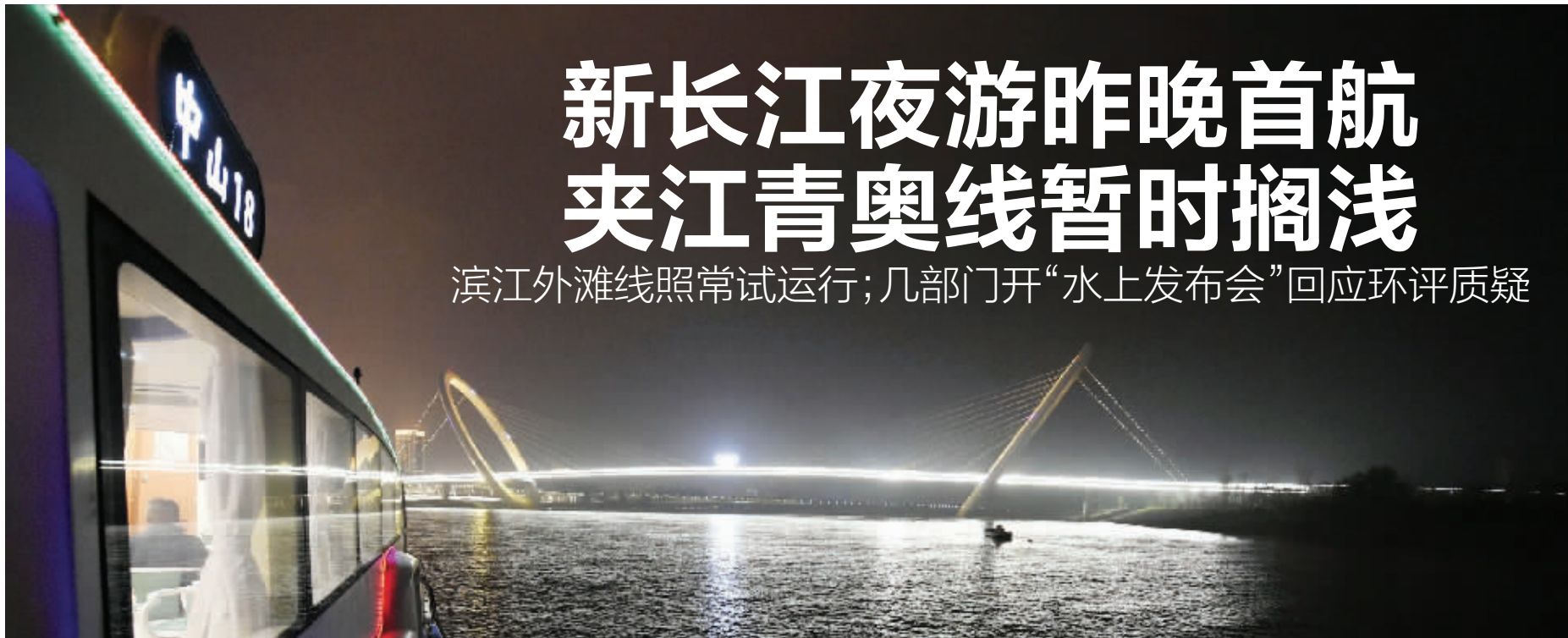
“中山18”号缓缓靠近“南京眼”