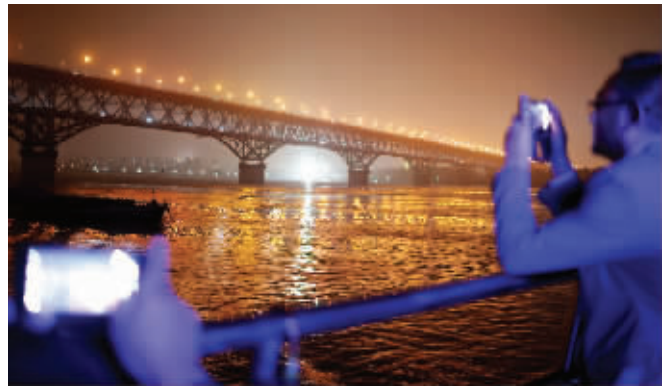
“中山103”号上,市民争拍长江大桥夜景