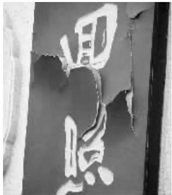
对联上有许多裂缝,表皮快脱落了