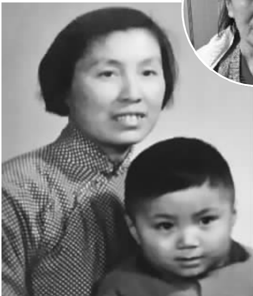
那时候,母亲还很年轻