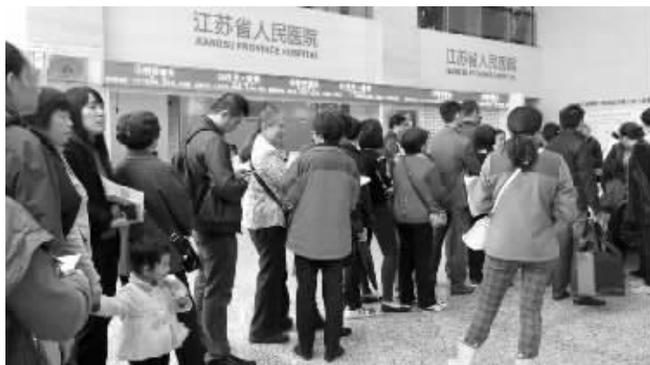
看甲状腺的人排起长队