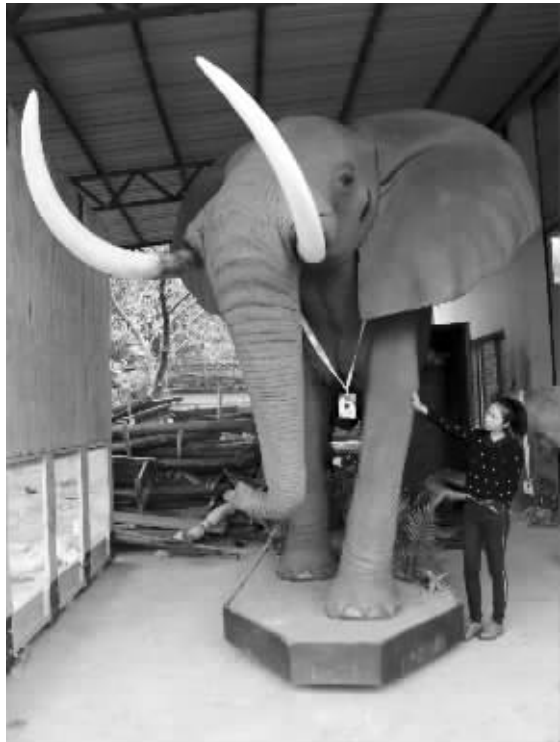
非洲象标本(左)、金毛羚牛标本(右上)、非洲狮标本(右下)

Q 庞大的非洲象、凶猛霸气的尼罗鳄、敏捷矫健的伊兰羚羊……仿佛让人置身于非洲大草原。昨日,记者在常州淹城野生动物世界见到了这批从南非远渡重洋而来的动物标本,其中最引人注目的是非洲象,它是国内个体最大的陆生动物标本。据介绍,最快10天后,这批标本将正式向游客亮相。