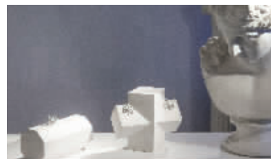
“Guardian of Love 爱的守护”之“红毯款Mini”系列