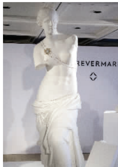
“Guardian of Love 爱的守护”之主题红毯款