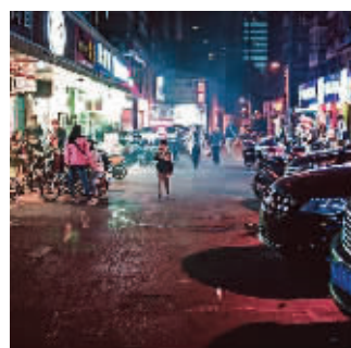
赵文嘉拍的这组照片,视角很独特