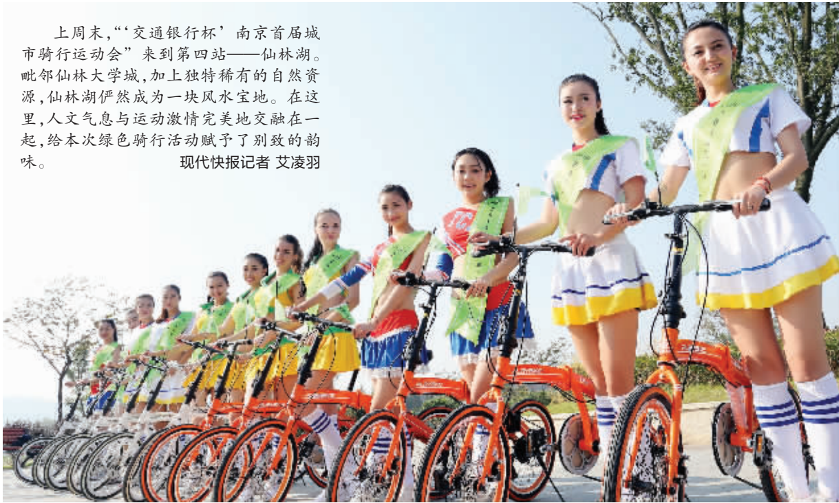
骑行活动是一道亮丽风景