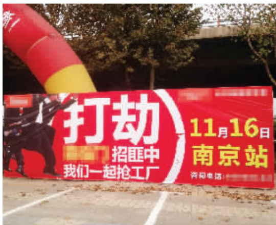
吓人的广告

本报讯(记者 朱蓓 见习记者 陈曦)昨天上午,市民张先生拨打现代快报热线96060反映,卡子门大街某家居广场门口,有广告牌上写着“抢劫,招匪中”等字样,比较醒目。张先生觉得,这些广告词似乎有点“过了”。