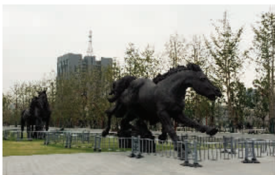
被围栏围起来的雕塑

“无奈下,我们只好决定给所有雕塑安装护栏,以免再‘受伤’。”相关人员表示,安装护栏后,破坏了不少。