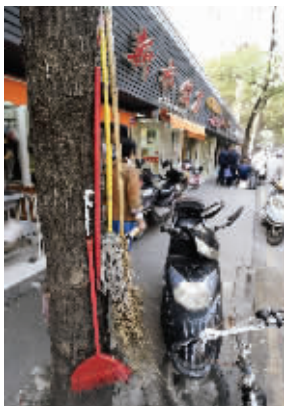
树干上挂着拖把和扫帚

随后,记者联系了南京市园林局,绿化处的一位工作人员称,在树上钉钉子,树木会出现伤口,有些病菌和害虫就会乘虚而入,大树易发生病虫害。还有些树木在成长过程中如果遇到伤害,会形成许多难看的疤。工作人员表示,他们会立刻派人前往处理。