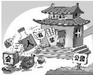
漫画: 禁止“走私” 新华社发 朱慧卿 作

近日, 中共中央办公厅、国务院办公厅转发了住房城乡建设部、文化部、公安部、民政部、商务部、税务总局、工商总局、国家旅游局、国家宗教局、国家文物局《关于严禁在历史建筑、公园等公共资源中设立私人会所的暂行规定》, 并发出通知, 要求各地区各部门遵照执行。