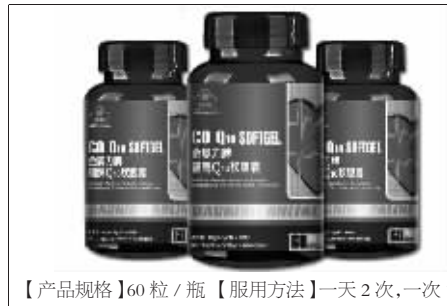
【产品规格】60粒/瓶 【服用方法】一天2次,一次1粒