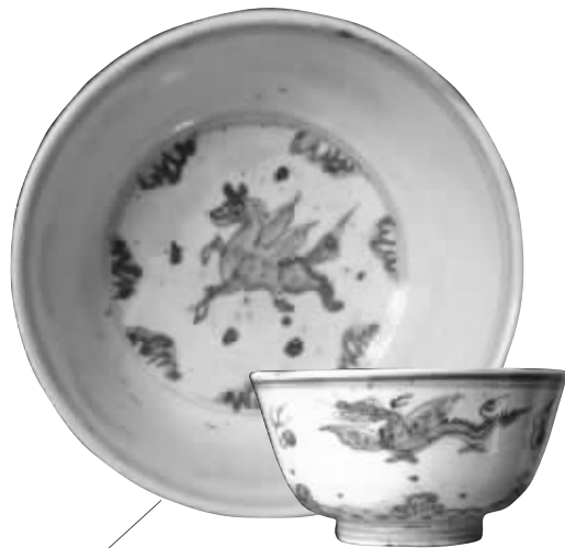
弘治年的青花碗

科举题材上属海的画面最多。康熙年青花梅瓶,画着一位状元手举桂花站在鳌头上,周边波涛翻滚烘托出蟾宫折桂和独占鳌头的气势。道光年的青花盘画着一人左手墨锭,右手毛笔准备点身边的斗,大海中的这一场景把状元的魁星点斗、独占鳌头生动地表现出来了。雍正年的青花残盘,画着大海中有一条龙和一条鱼,鱼跳过龙门就变成了龙,喻意是书生经过寒窗苦读考中状元。海,在这里就含有科举海选脱颖而出的意味。■