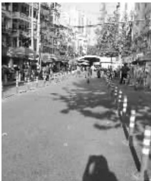
交警表示,安装站桩是不得已,之前想了很多办法都不能解决问题