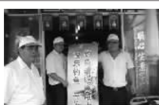
10月22日上午,海安供电公司宣传人员走进县城各渔具商店进行防钓鱼触电专项宣传,提醒前来购买渔具的垂钓者在钓鱼时远离电力设施,防止发生线下垂钓误碰触电事件。 李存根 戴永平

据了解,下一步,泰州供电公司将与政府联合开展废旧杆线专项清理活动,计划通过半年时间,对济川路、梅兰路、凤凰路、永定路、青年南路、江洲南路等城市主干道进行废旧杆线拆除。 周明亮