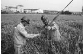
秋收之际,泰兴市供电公司组织党员志愿服务队,深入田间地头巡查,及时了解“三秋”农业生产用电需求,对农机设备开展检测。图为10月17日,泰兴市供电公司员工在该市广陵镇田间地头,检查安装拉线警示标志。 肖杰文