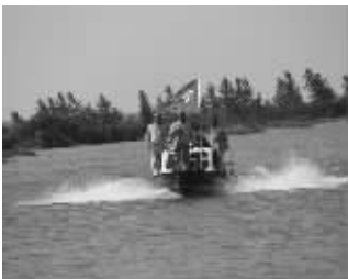
兴化供电公司针对该地区水网密布的实际,加大水上巡查力度,及时发现和消除线路安全隐患。 申祝存 杨峻峰