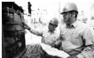
10月21日,徐州奎山变电站110千伏母联700号开关消缺及气动机构技术改造工作进入最后调试阶段,检修技术人员正在对主变进行最后的检查。 王金刚

管理措施是否执行到位。检查组要求施工人员要认真当前安全生产管理工作上所面临的严峻形势,深刻剖析自身在安全管理工作中还存在的不足和问题,全面提高安全管控能力;全面深入排查、整改公司在安全生产管理及施工中存在的隐患,确保秋检、施工期间的安全稳定;切实加强施工分包安全管理,全方位提升安全管理水平。 彭筱云