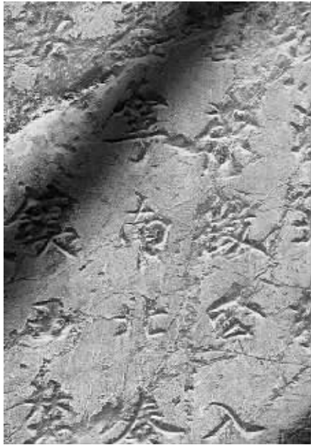
萧愔墓碑局部