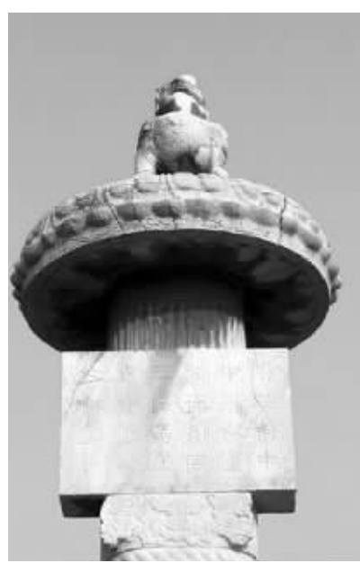
萧景墓神道石柱 资料图片