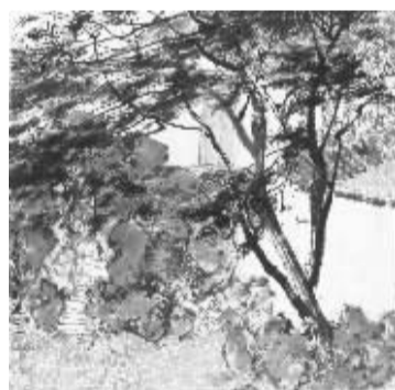
徐钢《网师园写生之二》