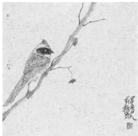
刘懿《花鸟图册之一》