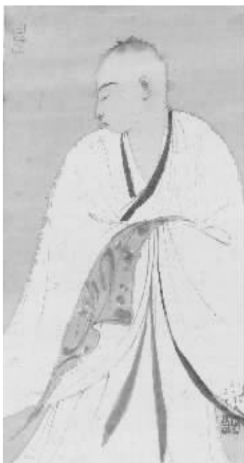
马骏《清凉图册之一》