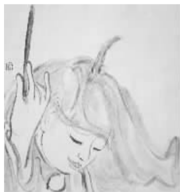
李桐《人物图册之一》

本次展览针对这一问题,邀请了全国十位符合此次展览主题的知名青年艺术家,给出既定的形式要求——手卷、册页,试图重新检讨这些传统的既定维度,能否在新体验方式中获得认知的新空间。也许,传统真正的价值,正在于面对传统时“意料之中”的“意料之外”。