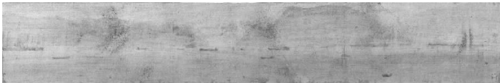
丁蓓莉《古老的航道》

由南京文化创意产业协会主办、芥墨艺术馆承办、杭春晓先生策划的“出——水墨系列展之传统的‘维’”展览于2014年10月25日下午3点在南京芥墨艺术馆拉开帷幕。