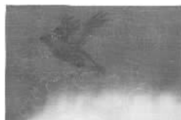
涂少辉《无住相图册之一》