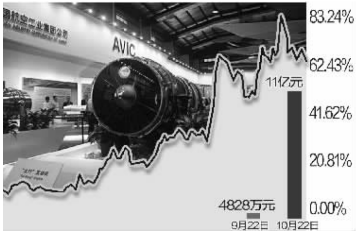
中航动控融资余额变化 制图 李荣荣

融资客的一举一动已能在A股市场中掀风起浪,10月10日以来沪指持续回调,但期间沪深两市融资余额从6427亿元升至10月22日的6807.04亿元,记者根据iFinD数据统计发现,9月22日~10月22日,不少新扩容标的被融资客相中并大肆加仓。