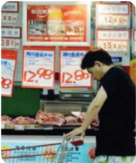
9月CPI回落至“1时代” 资料图片

随着9月经济数据的陆续公布,市场对基准利率降低的预期明显增强。不过对于银行理财产品来说,逐渐宽松的货币环境让其高收益的光环不再。面对理财产品收益率的持续走低,投资者应该如何修正自己的理财方案呢? 现代快报记者 艾凌羽