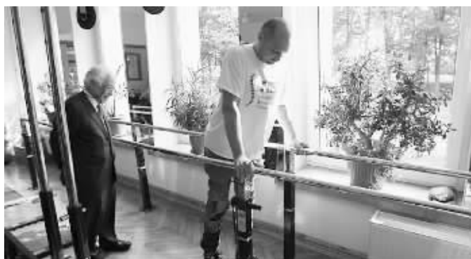
费迪卡可以在助行器的帮助下,撑着双杠走几步了