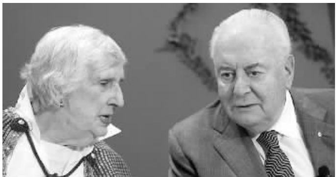
惠特拉姆和妻子玛格丽特

澳大利亚前总理惠特拉姆当地时间21日凌晨去世,享年98岁。他曾领导澳大利亚于1972年同新中国建立外交关系,并成为首位访华的澳大利亚总理。