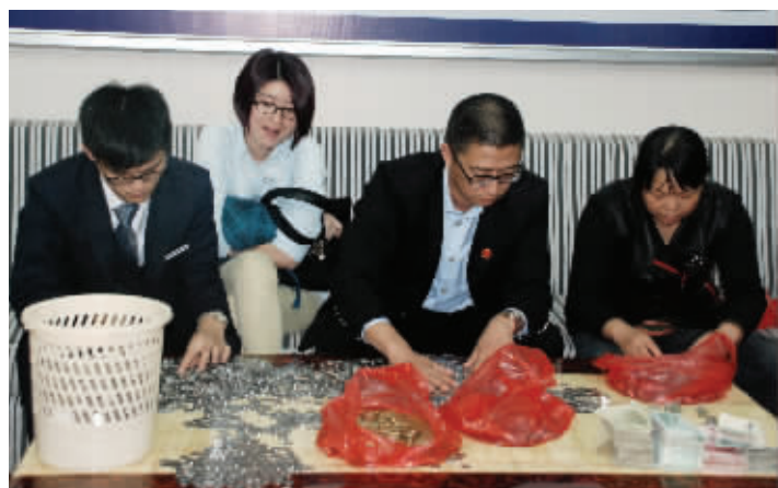
法院和银行的工作人员正帮忙清点硬币