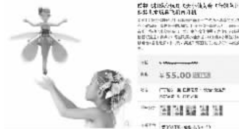
这款奇葩玩具在淘宝卖得很火