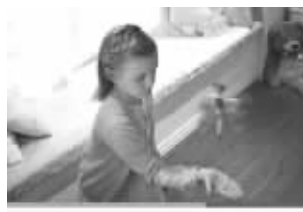
想象中应该这么玩