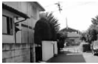
现实里竟然一去不复返了