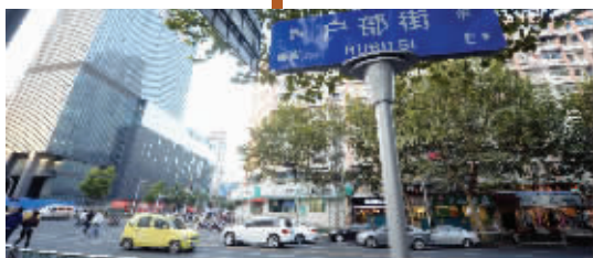
南宋建康行宫所在的位置就是今天户部街一带