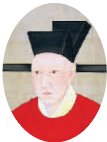
宋高宗赵构 资料图片

最近,南京图书馆馆藏影印典籍文津阁版《四库全书》专藏室正在对外开放,其中一套《景定建康志》吸引了不少市民的关注。修订于700多年前的《景定建康志》,是南京现存最早最完整的地方志文献,这套“鼻祖级”的方志文献,较为详细地记载了宋代以前南京的城市风貌、山川形胜、生活习俗等多方面的内容。翻开《景定建康志》,一个700多年前、甚至更久远年代的南京呈现在眼前。