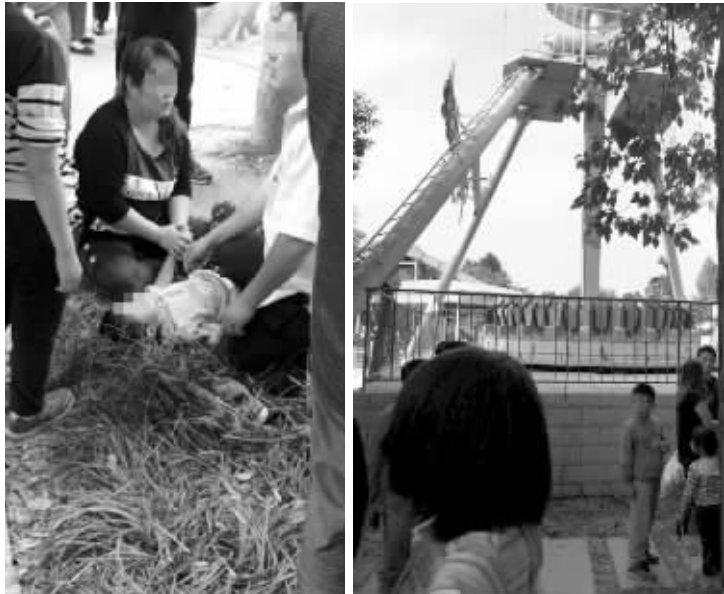
绿博园内游乐设施“太空飞碟”(右图)昨发生意外,一男孩在上面被甩了下来(左图)