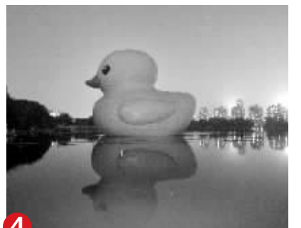
昨晚,大黄鸭亮相南京莫愁湖公园

根据10月19日省环保厅秸秆禁烧巡查和卫星遥感监测情况,截至19日17:30,全省未发现秸秆焚烧火点。