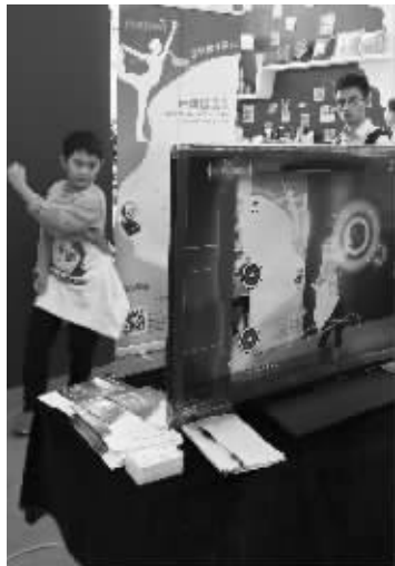
小朋友在体验“体感健身”

下个软件就能打造属于自己的“健身房”,随时随地健身,还有“私人教练”指导;年轻人热衷自拍,不妨来玩一下魔漫相机,还可以把照片做成“私人定制”的礼品;想要照片永久不褪色,那不妨把照片拿来微喷打印……正在南京国际展览中心举行的第七届中国南京文化创意产业交易会展示了不少好玩的创意项目,让人大呼过瘾。今天是最后一天,感兴趣的市民赶快去逛逛吧。