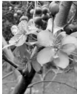
莫愁湖公园的海棠又开花了

快报讯(记者 余乐)昨天,市民孟先生到莫愁湖公园游玩,他惊奇地发现,公园一角的垂丝海棠树开花了。巧的是,前段时间在明孝陵红楼艺文苑,也有几株海棠开花,树上稀稀落落地挂着几朵淡红色的花朵,气候略微有点异常,它们就上当了。