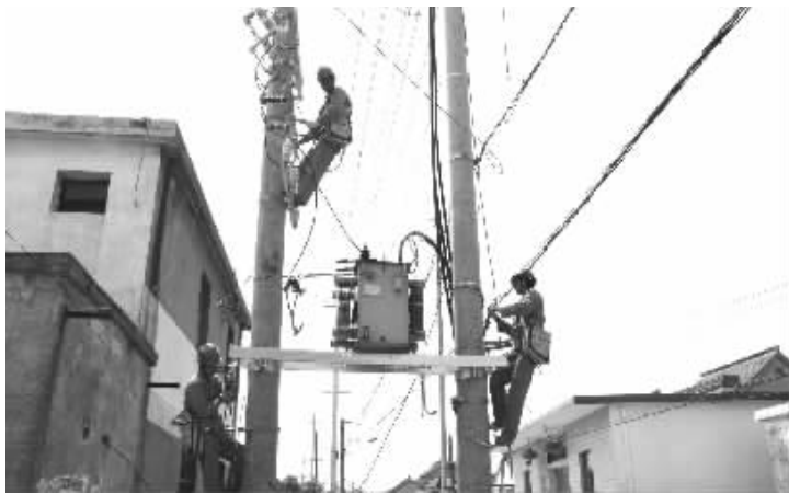
连日来,江都区供电公司加快迎峰度冬工程建设进度,力争在冬季寒冷天气来临前完成在手工程的建设验收。图为10月15日扬州市10千伏华工线路改造施工现场。