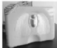
4. 传统治疗,每天需要到医院治疗

将数吨重的仪器,浓缩至只有几斤重,以往上百万元仅限医院使用的医疗设备,如今每天仅几毛钱的家用前列腺治疗仪,真正实现不吃药,不跑医院,自己在家治疗前列腺!