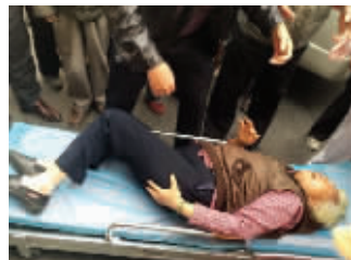
老太太躺在担架上被送往医院

昨天上午,扬州一名老太太从电动三轮车上摔到地上,其老伴称是一名过路小伙撞的,并要对对方负责。但现场多名目击者站出来给小伙作证,“我们都看到了,不是他撞的。”真相如何,现代快报记者就此展开调查。