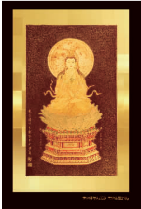
戴乐钟创作的黄金油画《盛世佛彩》