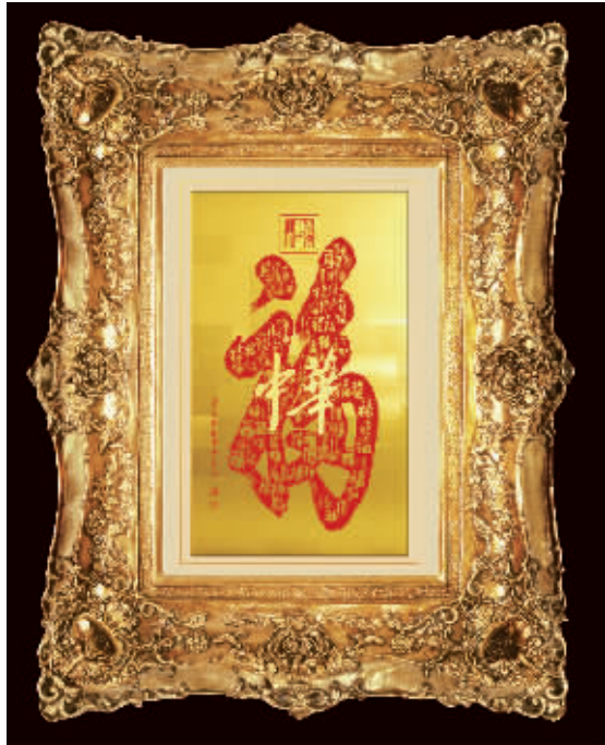
戴乐钟创作的黄金油画《百福佑中华》