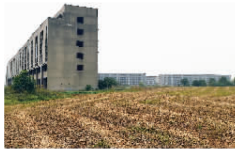
楼房周围杂草丛生,有人在空地种上了菜

在江宁区禄口街道信诚大道路边的一块土地上,盖着10多幢五六层的楼房,四周是菜地,看上去很不搭。现代快报记者了解到,这10多幢楼房建了一半就停工了,而且一停就是近6年。看到楼房周围还有大片土地,附近居民就开垦土地,种上了菜。这10多幢楼房为什么建了一半就不建了?昨天,现代快报记者到现场进行探访。 实习生 叶文字 现代快报记者 廖健伟