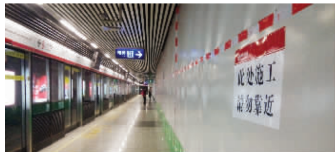
大行宫地铁站里的围挡有几十米高

近日,有市民向现代快报反映,大行宫地铁站里充满粉尘,气味刺鼻。