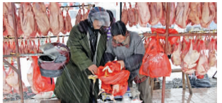
竹箦镇既有瓦屋山这样的美景(题图),也有咸鹅之类的美味

“生态建设投入大,看似吃了亏,但长远看,是推动区域经济社会可持续发展的催化剂。”横山桥镇党委书记储小平认为,花大力气推进生态文明建设,最终的落脚点是民生,这与群众路线一脉相承。