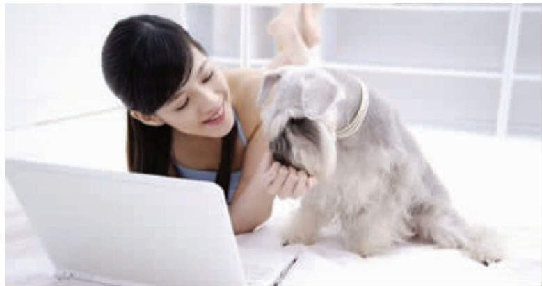
“宠乐保”预计2015年将覆盖全国 资料图片