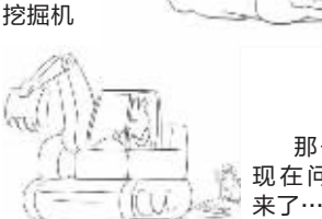
那么,现在问题来了……

那么,究竟有多火?现在百度输入“那么问题”“现在问题”“问题来了”等字眼,首页上几乎都是关于挖掘机的梗以及相关的段子。随着这个梗被网友丧心病狂地四处套用,一系列经典故事也开始走样。