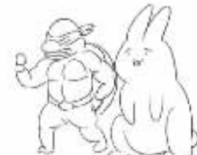
乌龟和兔子比赛赛跑