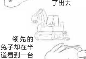
领先的兔子却在半道看到一台挖掘机