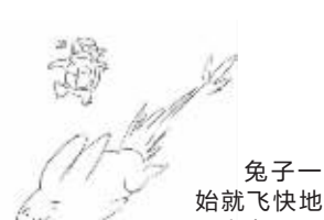
兔子一开始就飞快地冲了出去