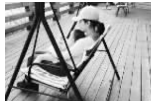
黄奕在微博中的配图

经法院调解,黄奕与黄毅清10日正式离婚。据悉,女儿归黄奕抚养,两人无财产分割。昨天,黄奕在微博上上传了和女儿的合影,并发布声明。通过声明不难看出,获得女儿抚养权的黄奕心情不错,写下“母女偕行,相互取暖”的句子,表达自己的心情。 辛郎