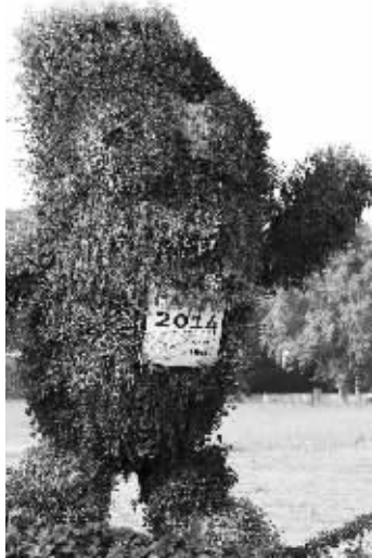
原本呆萌的砵砵, 青奥会后长期无人修剪, 无奈变成了“毛猴子”

南京城建集团: 部分绿植枯死, 三天内拆完, 砵砵只能说再见了 不少青奥设施“晚景凄凉”; 网友: 能修就修, 尽量不要拆啊