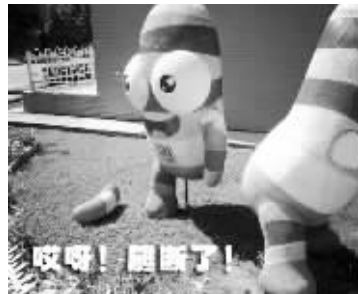
断了腿的砵砵(请拍摄者来领稿费)

就在紫峰大厦不远处, 在鼓楼转盘地铁4号线围挡的南北两个方向, 还有着两块电子屏正常显示的倒计时牌, 如今显示是“热烈庆祝青奥会取得圆满成功!”对此, 有市民在网上建议, 紫峰大厦前的倒计时牌可再利用, 像地铁4号线围挡前的倒计时牌一样, 写一些与南京青奥有关的东西, 以作纪念。