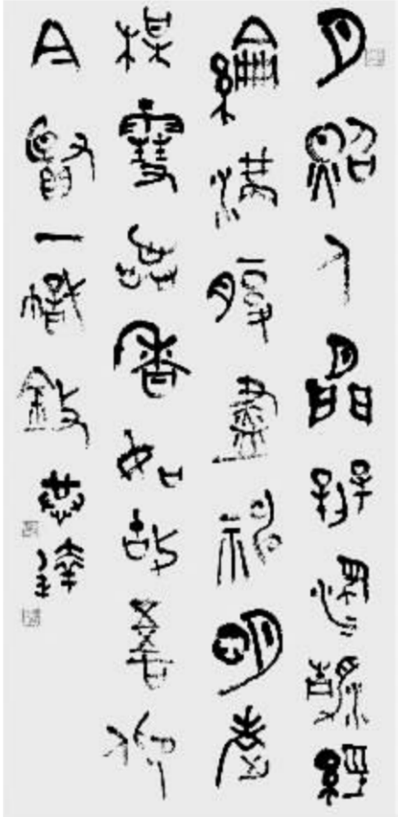
大篆 自作诗《季老赞》