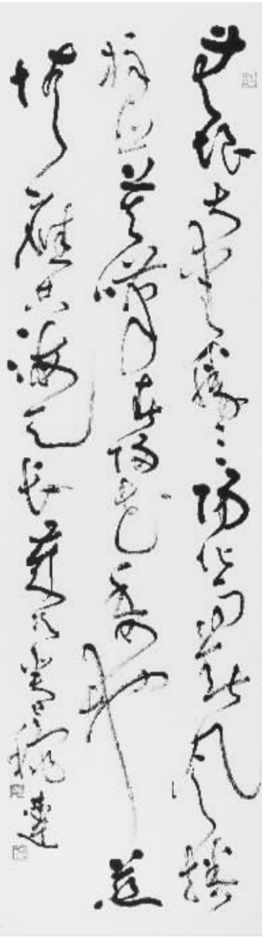
大草 自作诗《善行天下》