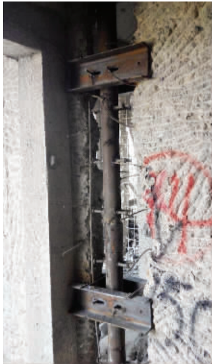
承重墙被敲开后“植入”了钢柱

这位负责人说:“武进区住建局对此事也高度重视,首先要求做好加固方案、施工的监管工作,接下来将对相关责任主体进行追责,按照上限进行处罚。”