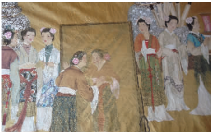
长达百米的绢画“红楼梦”中的一个场景