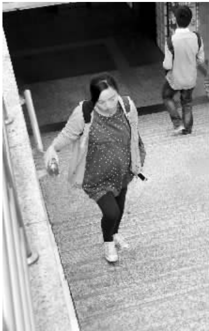
准妈妈上台阶挺辛苦

同样,地铁2号线西安门站4个出口,其中三个出口设置了自动扶梯,唯独通往西安门广场东侧的4号出口设置的是台阶。不过,记者注意到,这个出口只有1米多宽,相对较窄,这可能是无法设置扶梯的主要原因。