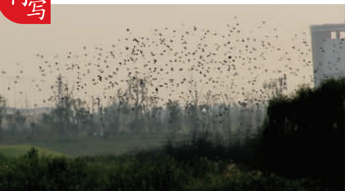
鸟类摄影师介绍,这些鸟儿是在觅食