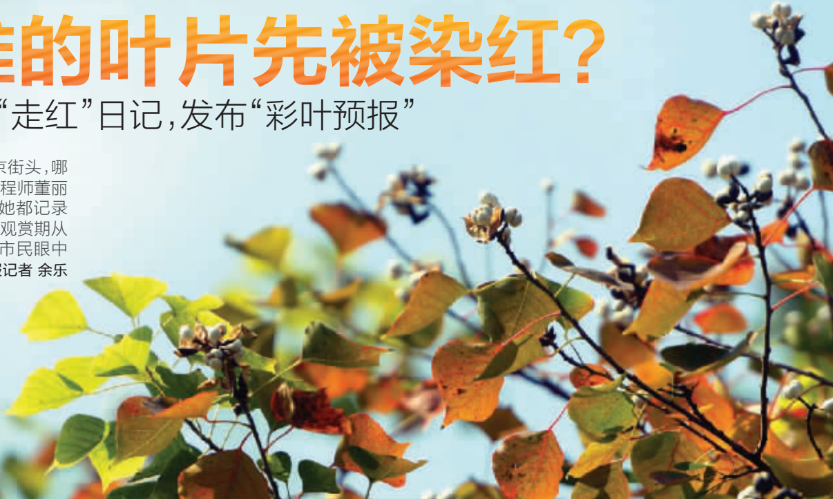
乌桕的叶子正在悄悄变色