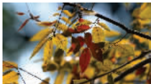
榉树的叶子变色最早

最先变色的树种,在同一地段,要数榉树了。根据董丽娜的记录,去年10月初,榉树已开始变红了。28日,她在石象路拍摄的图片显示,榉树已是满树“红云”,30日,依旧很美。到了11月2日,红叶便黯淡下来……据介绍,众多秋季变红的树种中,榉树和黄连木是“性子”最急的。“这两种树的生长期短。”董丽娜解释,一旦感知到低温的到来,它们便早早停止了生长,提前进入休眠状态。