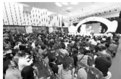
南京国际美术展开幕式现场

南京国际美术展就是要通过中国民营的资本力量,打造符合国际规则的公开透明的美术市场交易体系。本次“美展”的主办方南京布罗德文化投资有限公司是一家专注于为艺术家提供专业增值服务的文化公司。产业涵盖整个艺术发展生态链,包括“南京国际美术展”“南京凤凰山艺术园”“中艺易购”艺术品交易网、“布罗德·根艺术指数”、布罗德美术学院等项目。