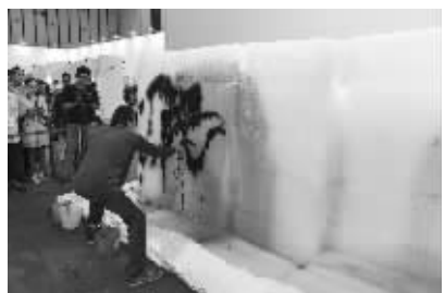
李广明现场即兴创作《融化的冰墙》

值得一提的是,主办方特别邀请艺术家李广明,现场带来《融化的冰墙》大型冰墙作品,即兴泼彩挥墨进行创作,并与现场观众互动,吸引了无数观众前来尝试。