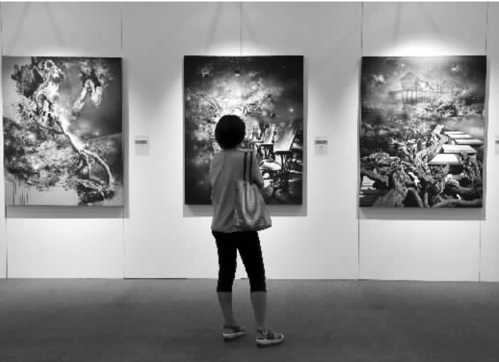
观众驻足欣赏作品