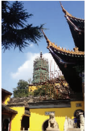
慈寿塔被施工围挡包裹

“来镇江金山,慈寿塔和法海洞都参观不了,票价还是和以前一样,就不能打个折吗?”昨天,有游客向现代快报记者反映,西北山巅的慈寿塔和法海洞都参观不了,景区票价并未相应降低。现代快报记者了解到,目前,慈寿塔正在经历20多年来的首次大修,暂不开放。对于游客希望票价打折的建议,景区有关负责人称,票价不能随便更改。