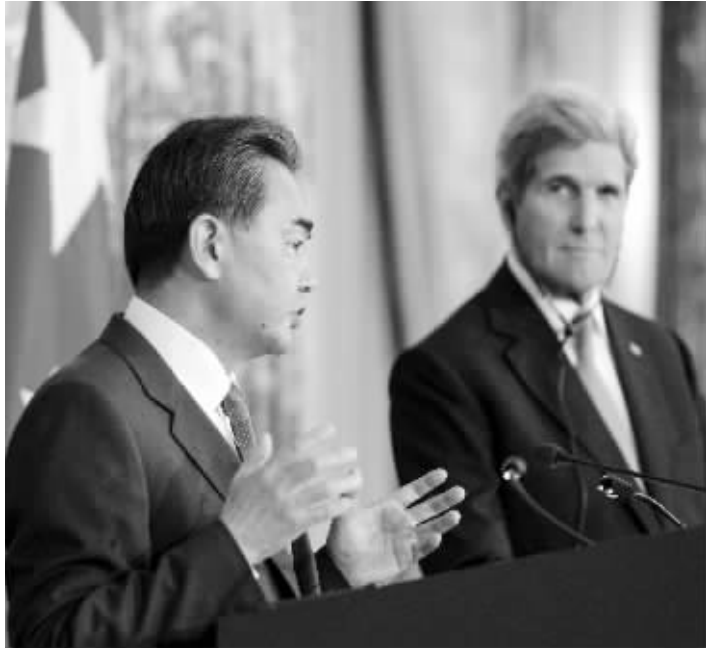
10月1日，王毅（左）与克里共同出席记者会

中国外交部长王毅访美期间，在美国白宫、国务院与美方领导人会谈会晤时，明确阐述了中方对有关香港事态的立场。