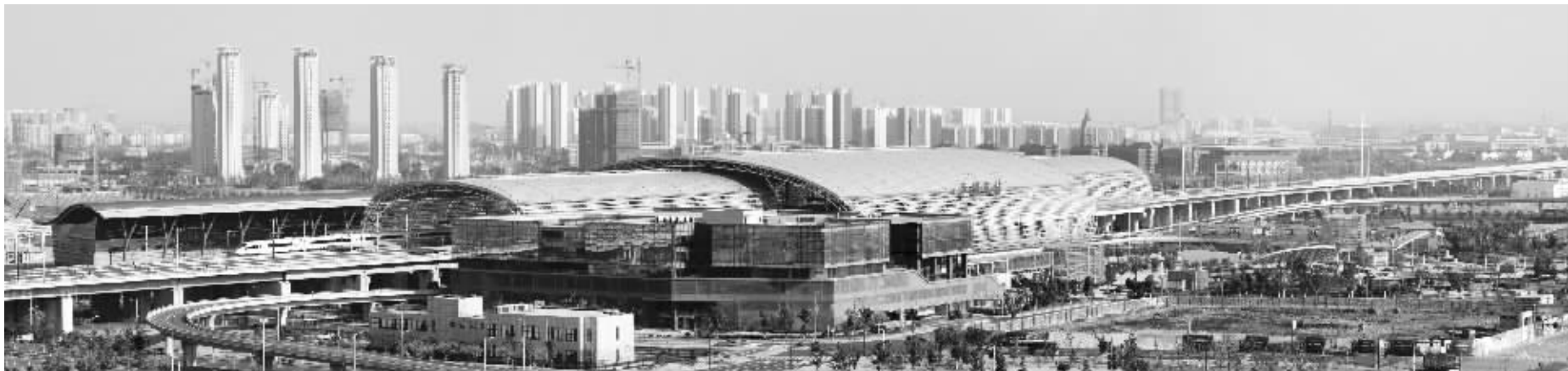
锡东新城商务区核心区局部