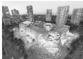
润发购物中心效果图