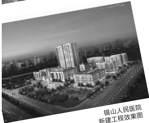
锡山人民医院新建工程效果图