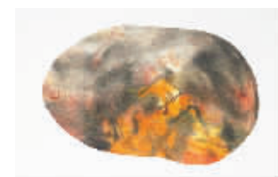
邵晓峰《瑶昆高秋》局部